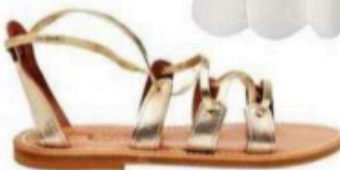
Spartiates, K.Jacques, 235 €.