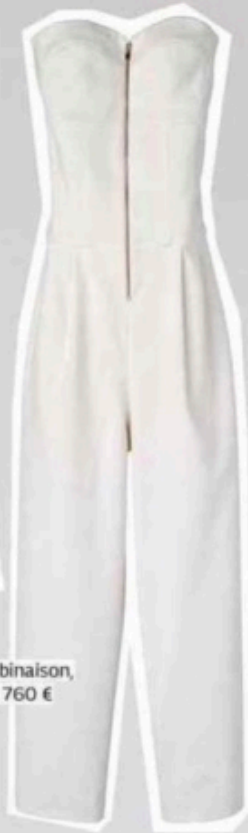
Combinaison, Tibi, 760 €