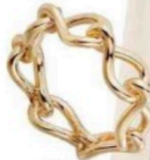
Alliance, Cartier, 1560 €.