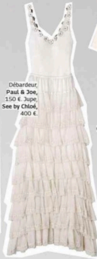
Débardeur, Paul & Joe, 150 €. Jupe, See by Chloé, 400 €.