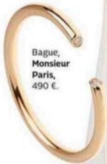
Bague, Monsieur Paris, 490 €.