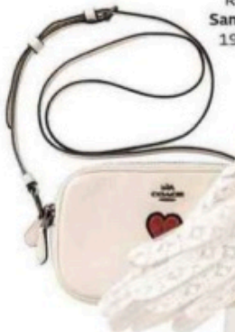
Sac, Coach, 195 €. Gants, Galeries Lafayette, 20 €.