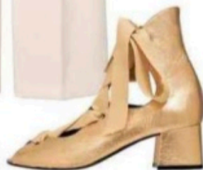
Babies, Carel x Jourden, 395 €.