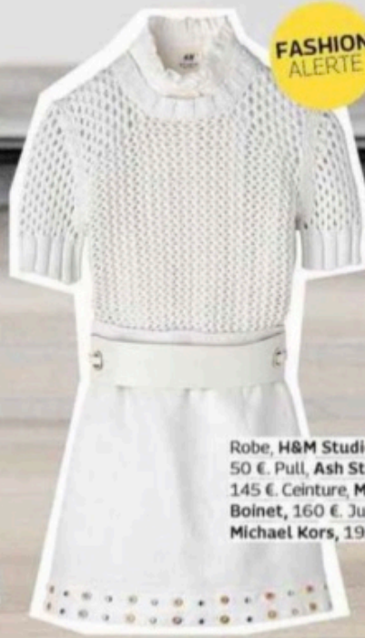
Robe, H&M Studio, 50 €. Pull, Ash Studio, 145 €. Ceinture, Maison Martin Margiela, 160 €. Jupe, Michael Kors, 195 €.