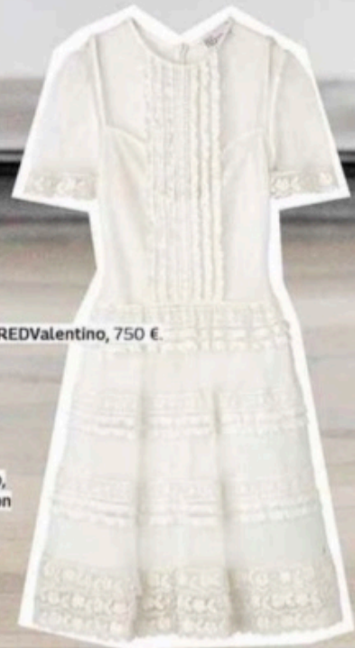
REDValentino, 750 €.