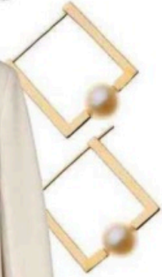
Boucles d'oreilles, Misaki, 259 €.