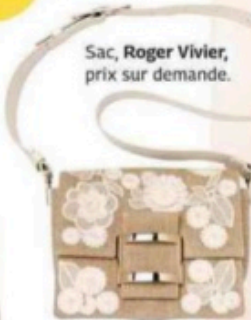
Sac, Roger Vivier, prix sur demande.