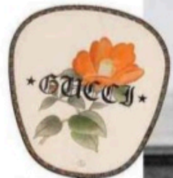
Eventail, Gucci, 180 €.