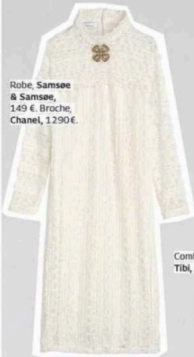
Robe, Samsøe & Samsøe, 149 €. Broche, Chanel, 1290€.