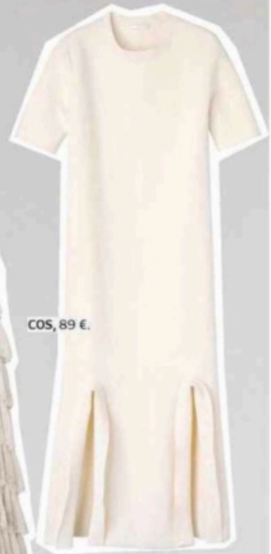
COS, 89 €.