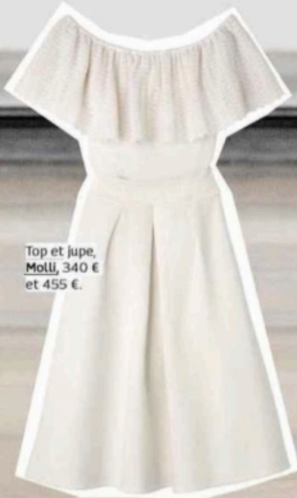
Top et jupe, Mollie, 340 € et 455 €.