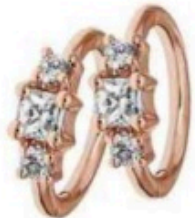
Minicréoles, Maria Tash chez Hod, 465 € l'une.

Sagement rétro ou résolument moderne, la simplicité fait son effet. Comment ne pas dire oui? Par Tiphène GUISSARD