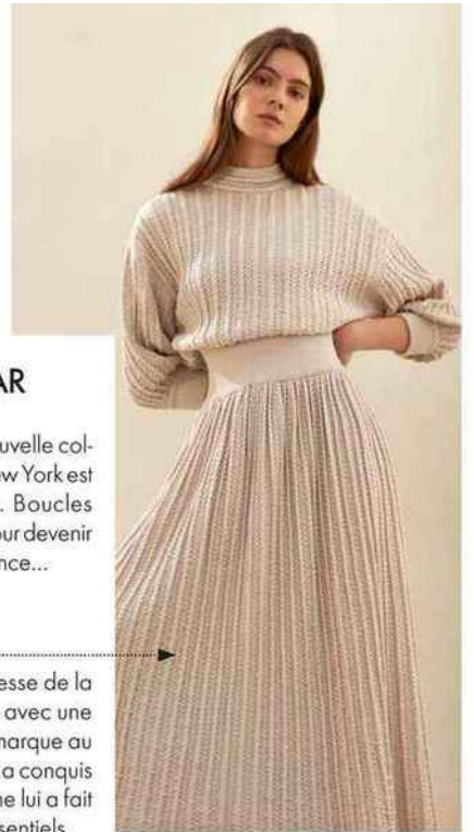
12 MAI 2017